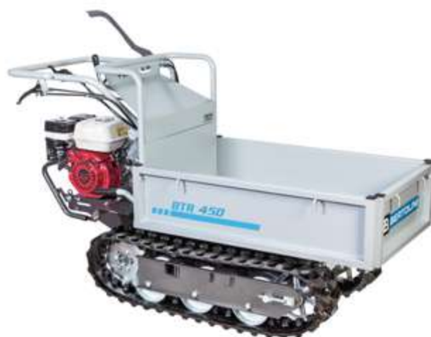
Nell'immagine BTR 450 con motore Honda GX 160 OHV