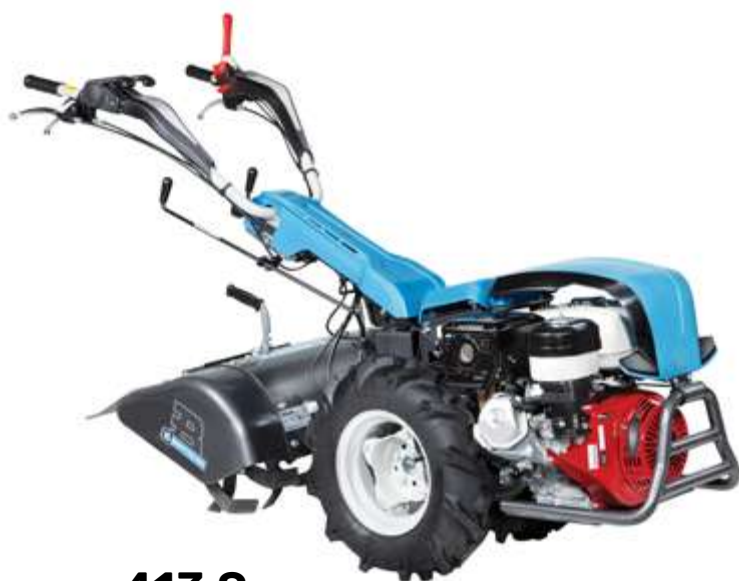
Nell'immagine: 413 S con motore Honda GX 270 OHV

OPPURE 12 RATE DA 291,58 € TASSO ZERO TAN 0% TAEG 0%