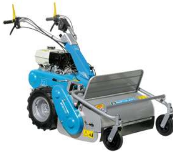
Nell'immagine BTS 65 con motore Honda GX 340 OHV