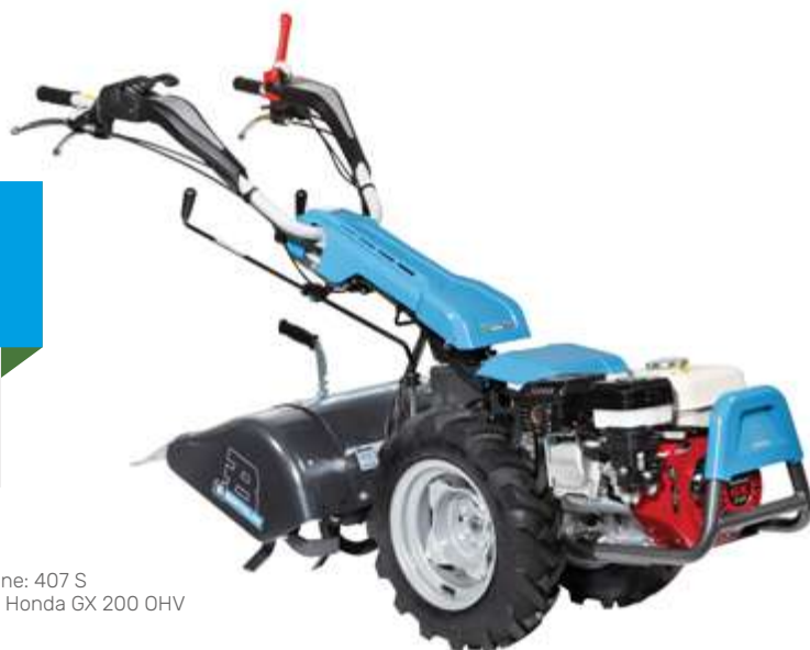
Nell'immagine: 407 S con motore Honda GX 200 OHV

Con il portattrezzi puoi innestare l'assolcatore e creare solchi di piantumazione e piccoli canali di scolo.