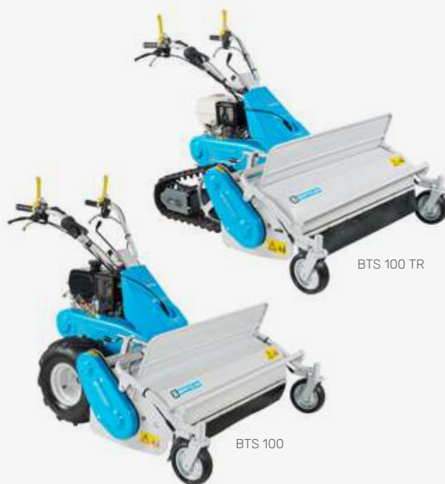
BTS 100 TR