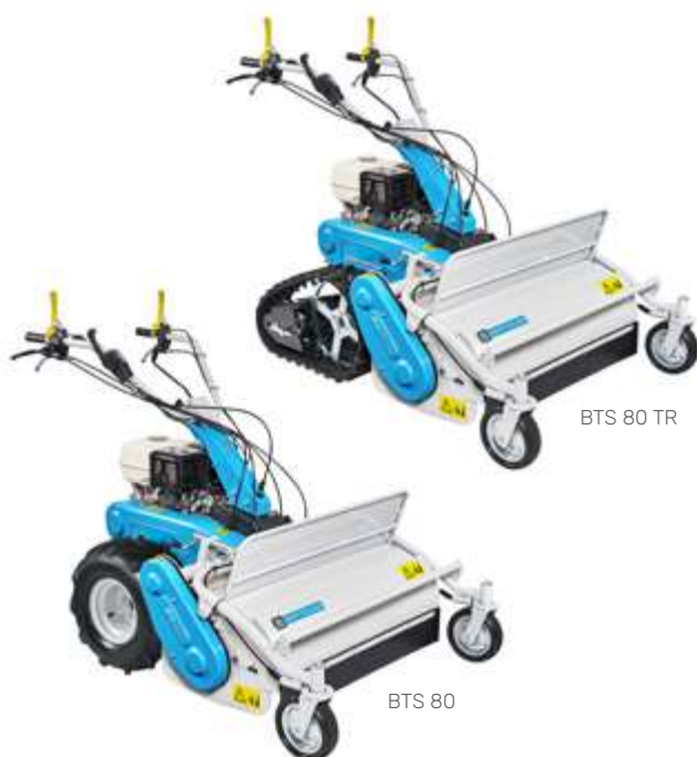
BTS 80 TR

L'ampia larghezza di taglio e i motori potenti assicurano prestazioni elevate e velocizzano il lavoro anche nelle condizioni più impegnative.